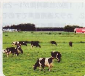
牧畜・果実被害に