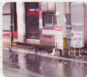
市街地の環境対策に