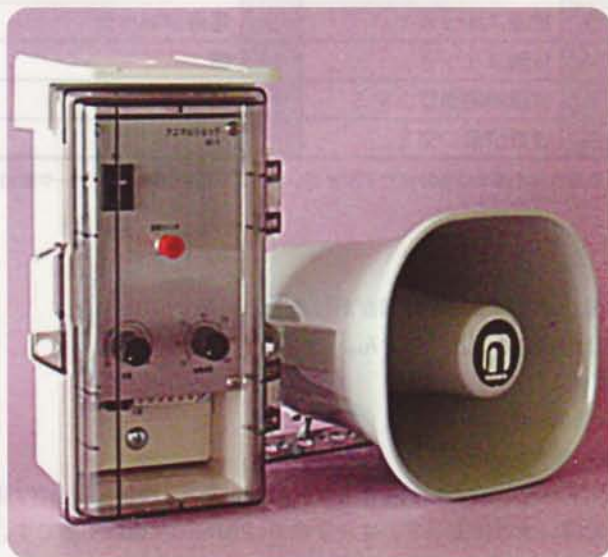
電子式鳥害防除装置 アニマルショック AS-1型